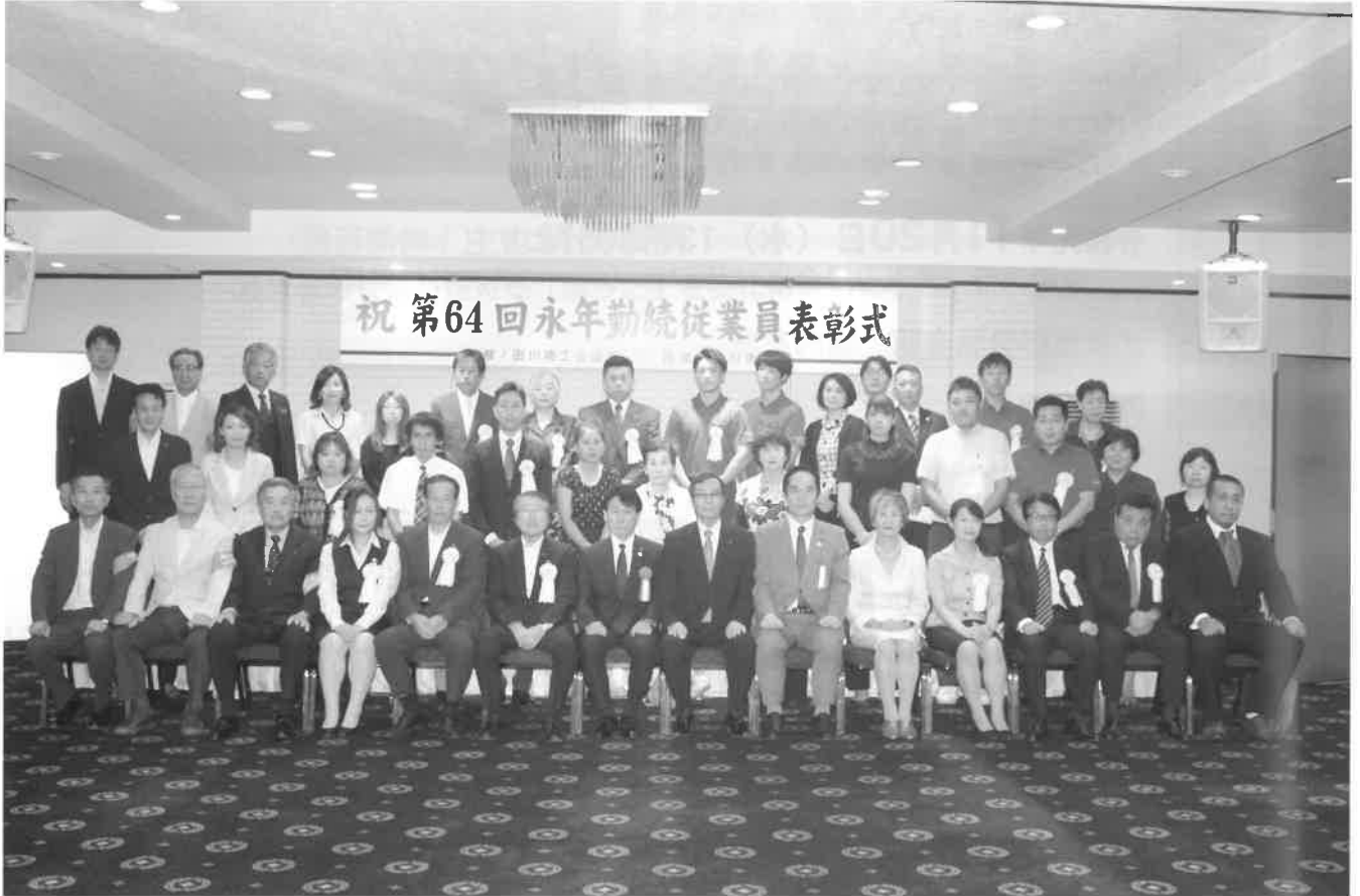
当日出席された被表彰者、事業主、関係者の皆様