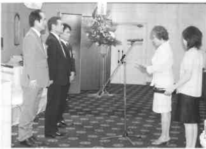
表彰を受けられた皆様、おめでとうございます！