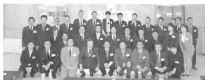
懇親会での役員紹介

さらに、総会に引き続き行 われた懇親会では、ご来賓も お招きしての盛大な交歓の場 となり、総会並びに懇親会は 盛会の内に終了しました。